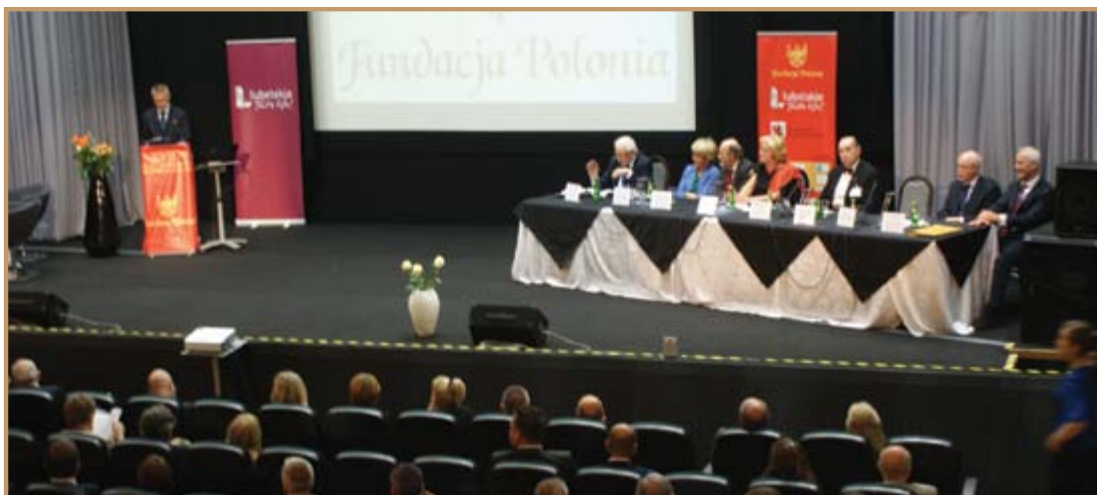
Prezes Zarządu Fundacja Polonia Gospodarcza Świata

Do udziału w konferencjach zapraszamy bezpośrednio i przy udziale placówek dyplomatycznych RP przedstawicieli polonijnego biznesu z kilkudziesięciu krajów świata, przedstawicieli władz państwowych, samorządowych oraz mediów, a dialog z uczestnikami prowadzony jest przez osoby o najwyższych kompetencjach i pełnej orientacji w zachodzących procesach gospodarczych z uwagi na sprawowane funkcje w naczelnym organach państwa.