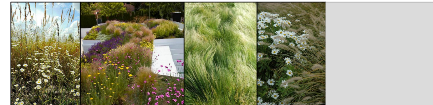
PROJEKTOWANA ROŚLINNOŚĆ ŁĄKOWA NA TERENIE INWESTYCJI

ISTNIEJĄCA SIŁOWNIA PLENEROWA do zachowania; wymiana ławek i oświetlenia