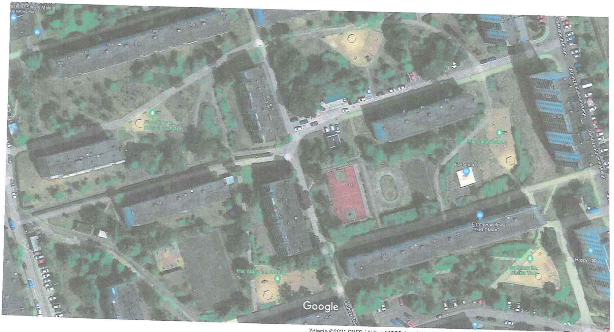
Zdjęcia ©2021 CNES / Airbus,MGGP Aero,Maxar Technologies,Dane mapy ©2021 Google 20 m