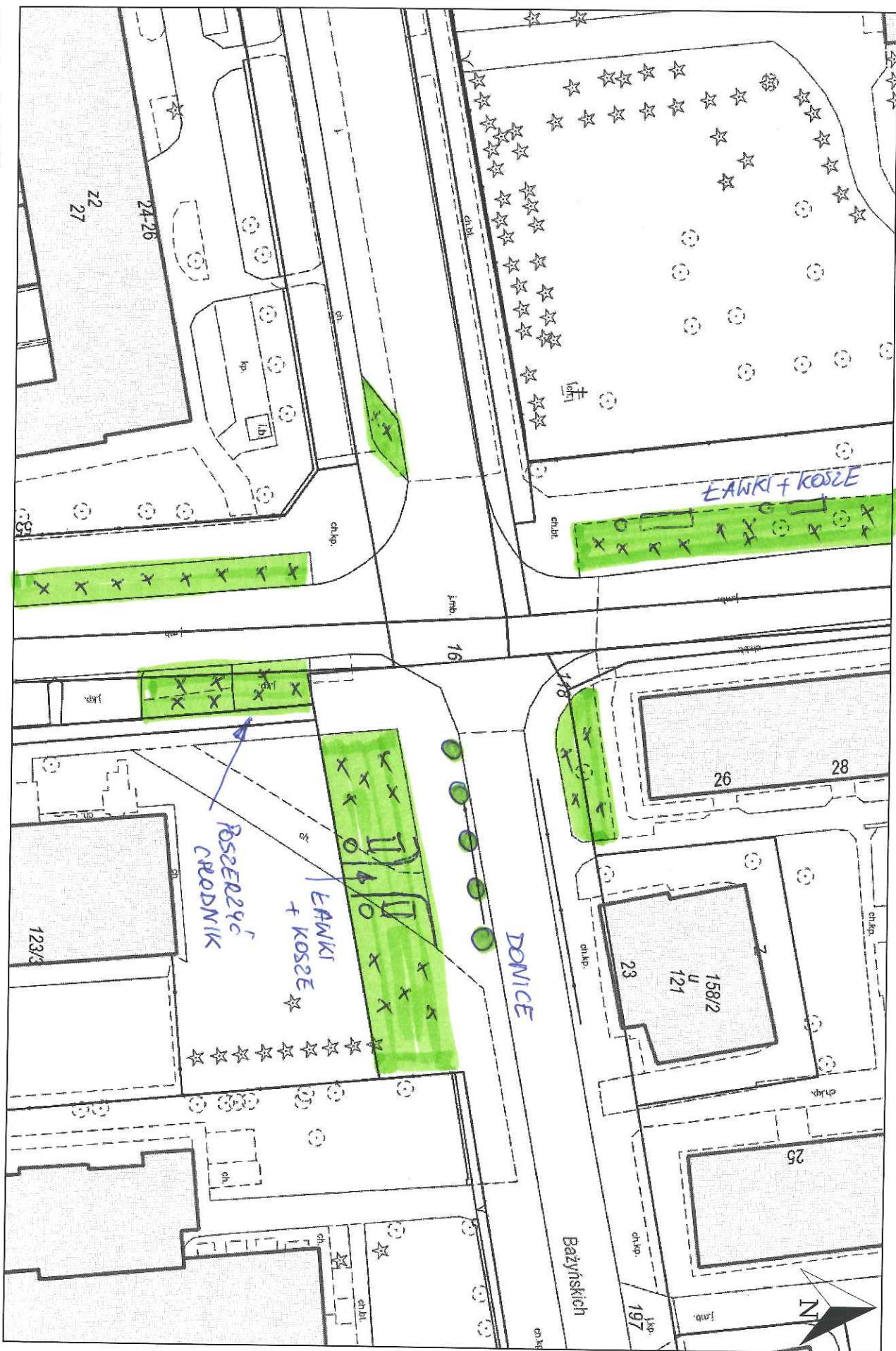
Wydruk w skali 1:500