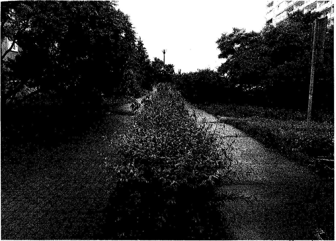
K - Pny skarpie