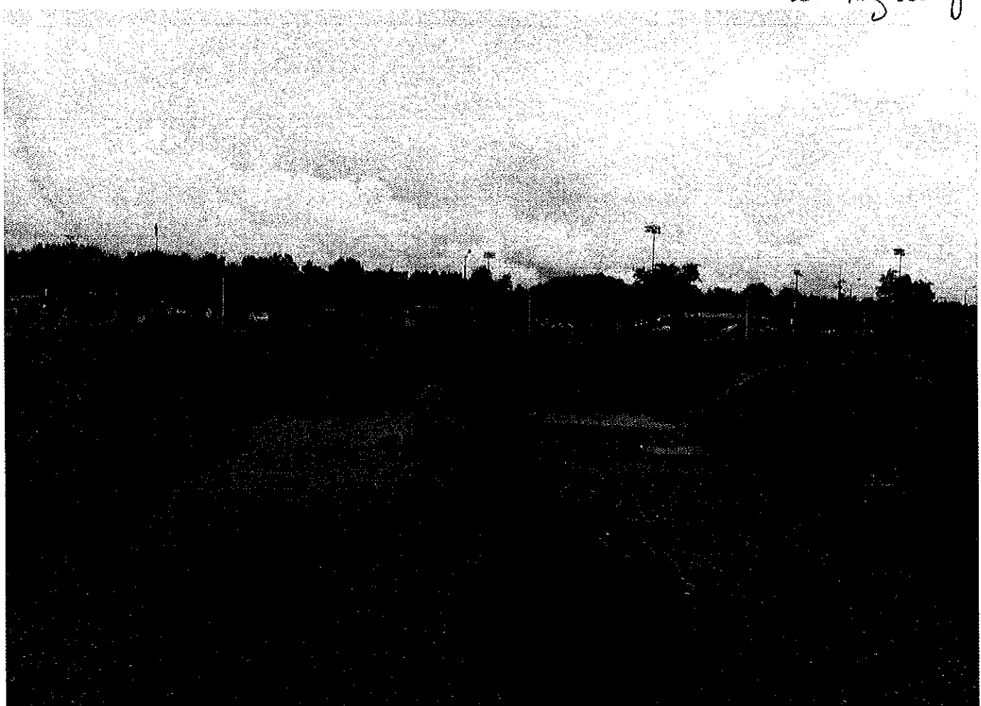
Pisypaci z Pny skarpie