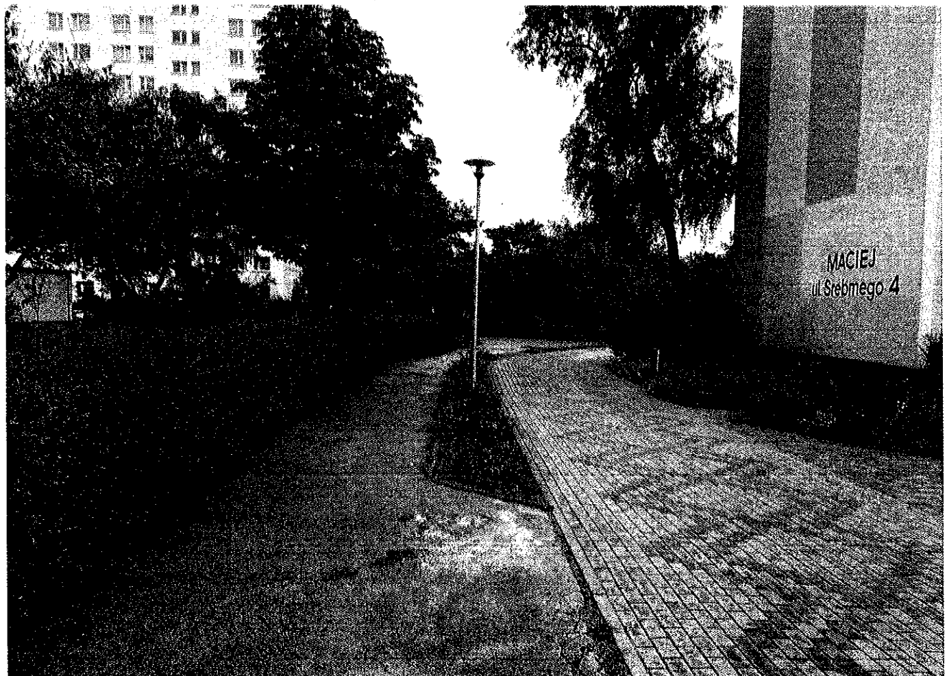
U. Miasteczka Ruda Dużego