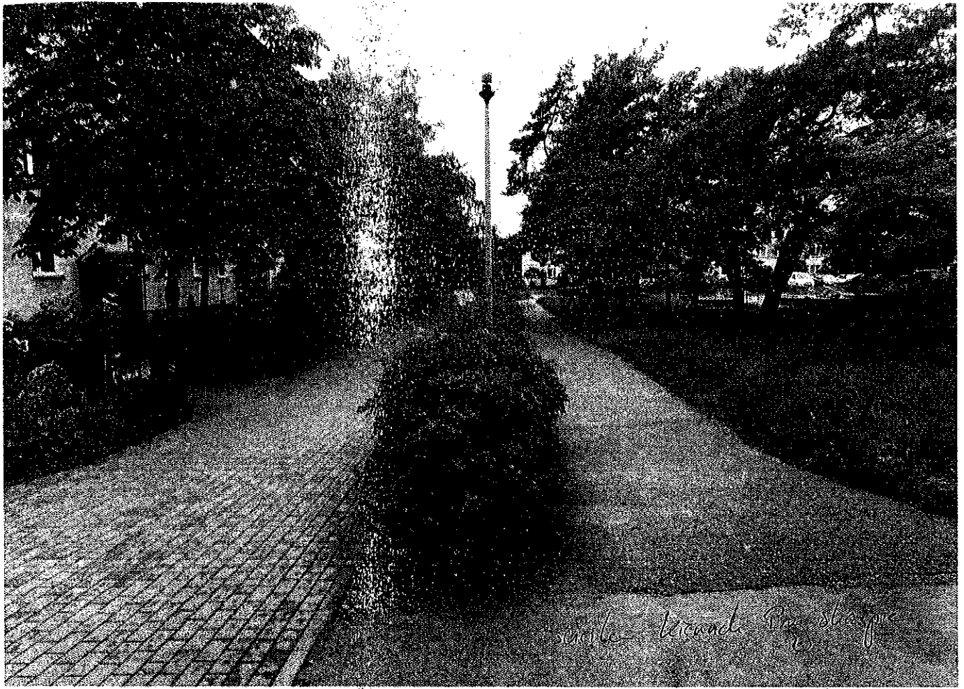
Monument - Friends of the Park