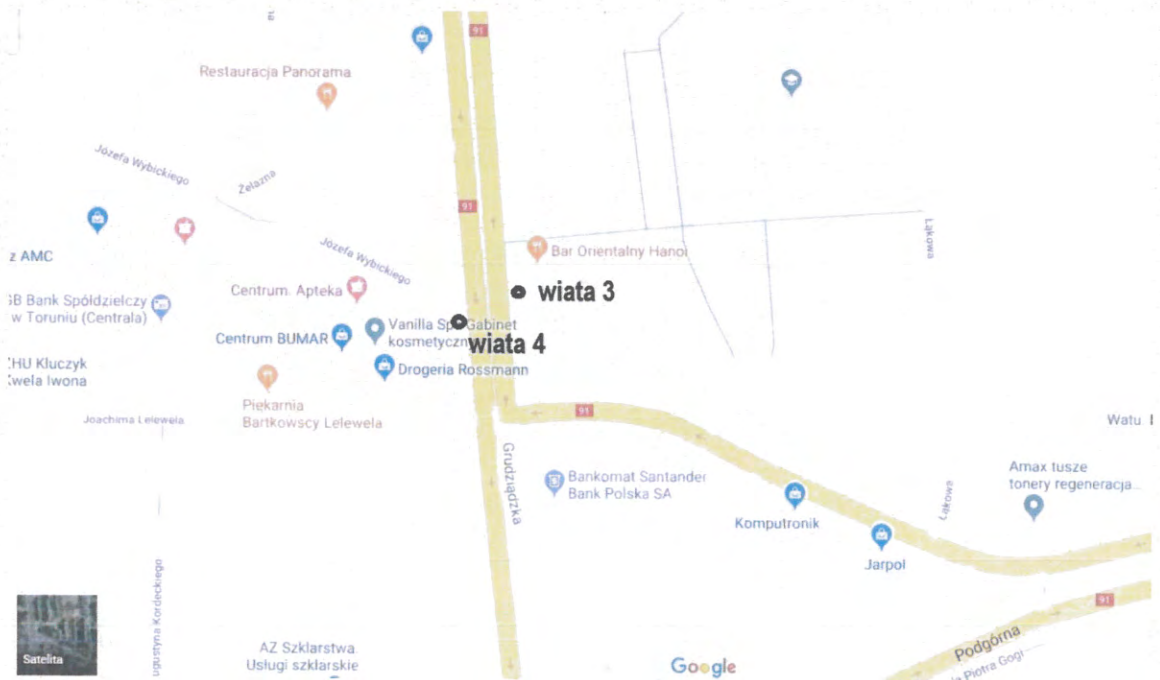
Zał. nr 2 Mapy lokalizacji.