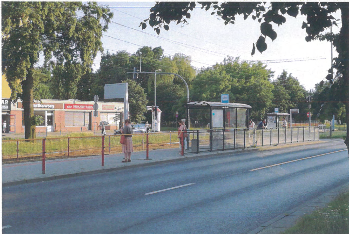
Zał. nr 4 Lokalizacje. Wiaty północnej nitki ul. Kościuszki