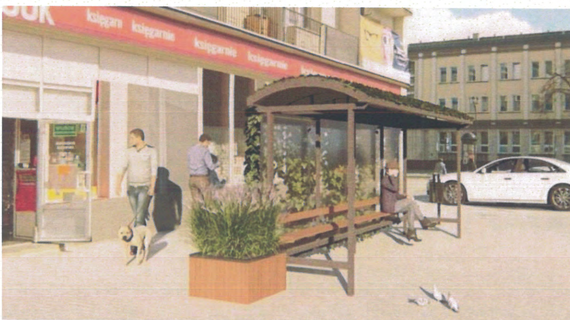
Zał. nr 3 Przykłady realizacji.