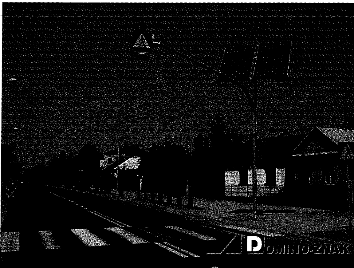
Rysunek 1 Przykładowe oznakowanie i oświetlenie przejścia dla pieszych, Źródło: http://www.domino-znak.pl/uploads/realizacje/r29.jpg

Projekt zakłada poprawę bezpieczeństwa na przejściach dla pieszych m.in. poprzez montaż widocznych z daleka, aktywnych, intensywnie oświetlonych (np. diodami LED) znaków D6 (przejście dla pieszych) oraz dodatkowego oświetlenia na wszystkich sześciu (6) przejściach dla pieszych.