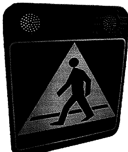
Rysunek 2 Znak aktywny D6