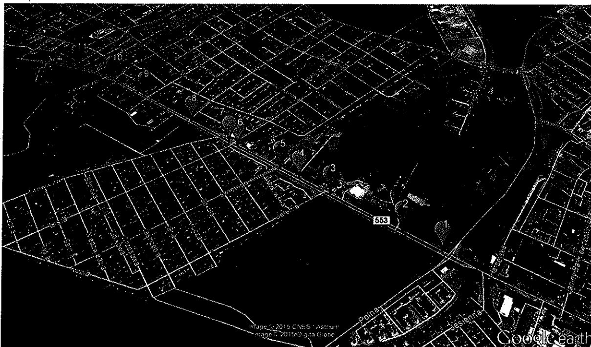
Rysunek 3 Lokalizacja przejść dla pieszych na odcinku Szosy Chełmińskiej od ul. Polnej do ul. Zbożowej